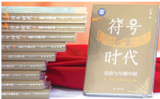
《符号时代：信仰与早期中国》

在《符号时代：信仰与早期中国》中，作者对华夏大地各处考古遗址、遗迹、遗物娴熟于心、信手拈来，基于缜密的考古研究和严谨的学术理路，从符号入手，对早期中国信仰世界进行系统完备的阐释，进而探求中华文明的起源、多元一体文化品格的形成和华夏文化绵