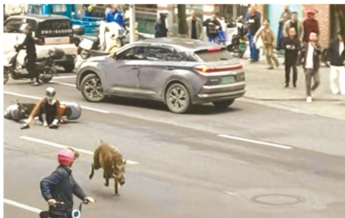
2024年10月25日,浙江杭州建德市街头,一头160斤野猪闯入市区乱窜伤人。网络视频截图

当你在野外遇到了一群野猪怎么办?偷偷地走开可能是个办法,因为一群野猪在一起时伤害性相对要小一些。需要注意的是当你在野外遇到了一头野猪怎么办,往往一头单独的野猪是最有攻击性的。