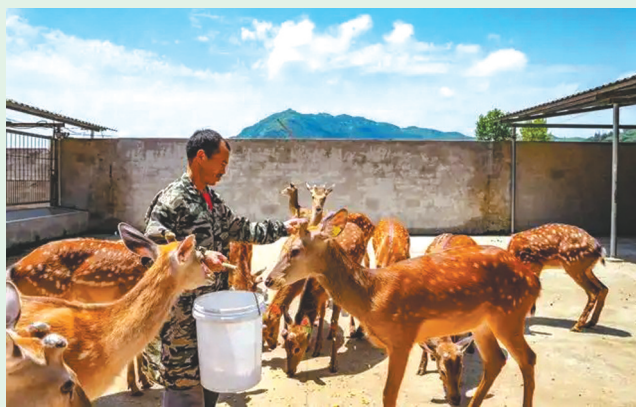
村民在贵州省铜仁市江口县桃映镇小屯村梅花鹿养殖基地给梅花鹿喂食。