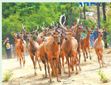
▲ 2018年5月4日，河南省野生动物野外驯化基地揭牌暨梅花鹿野化放归活动在济源举行。