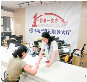
一件事一次办不动产登记。

描绘城市乡村“美美与共”新画卷,射洪分批次推动城市能级不断提升,镇村面貌不断蝶变。完成9个集镇更新,建成小型文化公园7座,完成道路黑化改造50余公里。