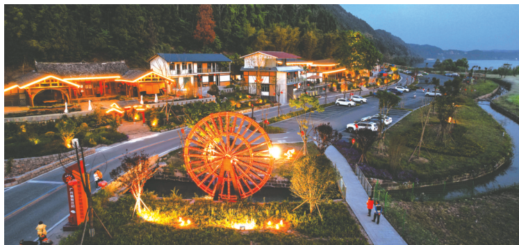
射洪双江村两江画廊。

加快发展新质生产力。射洪鼓励企业数字化转型,在食品饮料等行业引入先进的智能制造系统,提高生产效率和质量管理水平,产业竞争力逐步提升,工业增加值中技术与创新贡献占比增加,产品市场上的科技含量优势逐渐凸显,部分企业通过数字化降低了近20%的人力成本和15%的资源消耗。射洪在“智改数转”工作上成绩亮眼。紧抓基础,实现“智改数转”培训与诊断全覆盖,企业上云率达80%,为数字化转型筑牢根基。