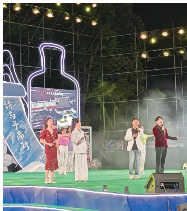
第二届沱牌之夜舍得美酒音乐活动。