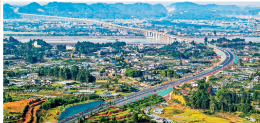
► 乐西高速公路乐山绕城段。