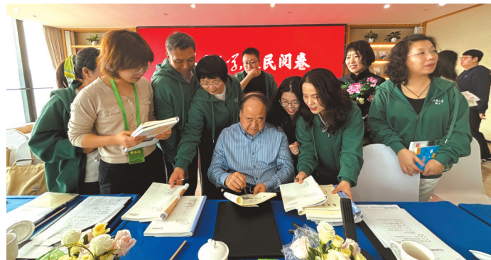
▲莫言给读者签名

在这场活动举办期间,华西都市报、封面新闻记者采访到莫言。记者提到12年前,莫言为华西都市报读者题写的“读书、善思、勤奋、识礼”8个字,勾起了他的美好回忆。此外,莫言了解到“两块砖墨讯”公众号在封面新闻客户端上同步更新的最新读者反馈后表示赞赏。得知《华西都市报》即将迎来创刊30周年,他欣然送上祝福:“祝《华西都市报》创刊30周年生日快乐。”