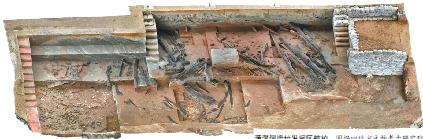
濠溪河遗址发掘区航拍。

文物,是历史的见证,浓缩着时间厚重,铭刻着“我们从哪里来,到哪里去”的基因密码;文化遗产,凝练着历史文明,是连接过去与未来的桥梁。