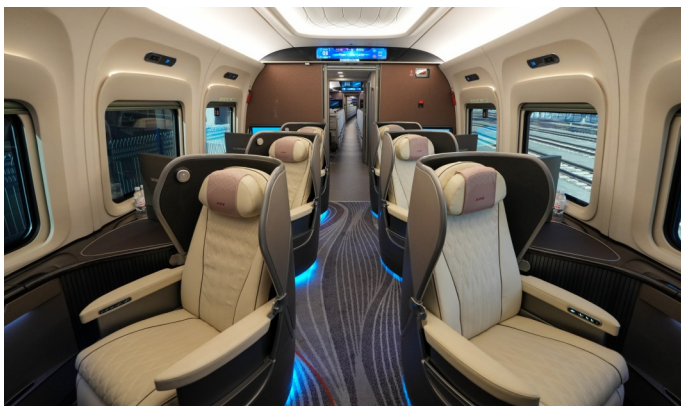
12月29日拍摄的CR450AF动车组样车车厢内部商务座。