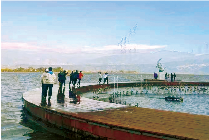
喷泉淋湿路面，游客担心湿滑容易掉落水里。

以及喷泉池四周都没有安全围栏，但是地面贴有安全标识，提示游客注意安全，小心跌倒和落水。不过，在剧场北侧的人行栈道上设有围栏。