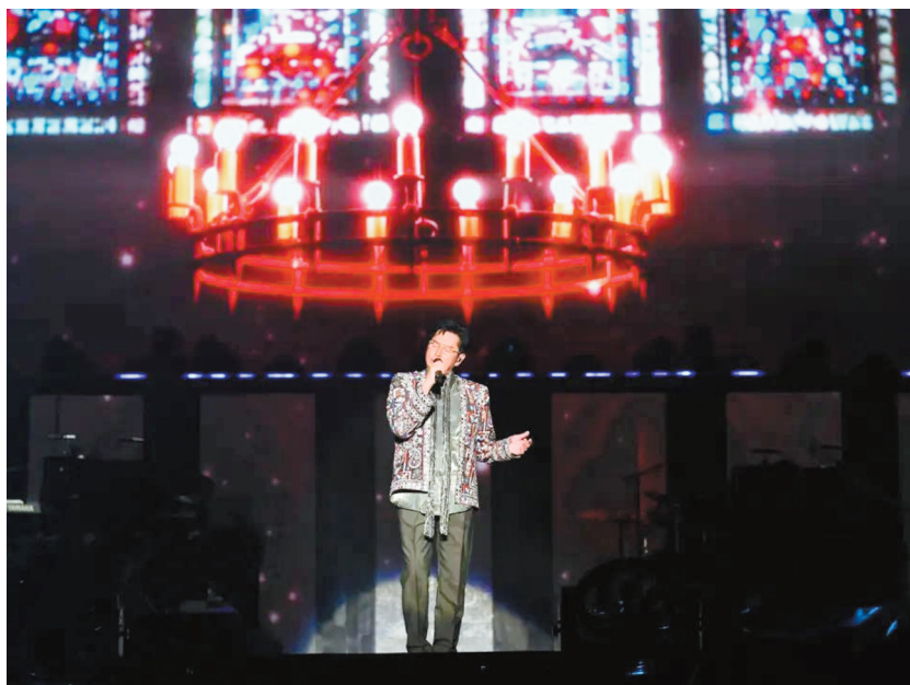
谭咏麟演出照(资料图)。

业内人士分析，情怀类演唱会或许与KTV的没落有关，“现在大家已经不怎么去KTV了，演唱会就变成了另一种KTV现场，让大家能一起唱歌、抒发情绪、缅怀青春。可以说，情怀类演唱