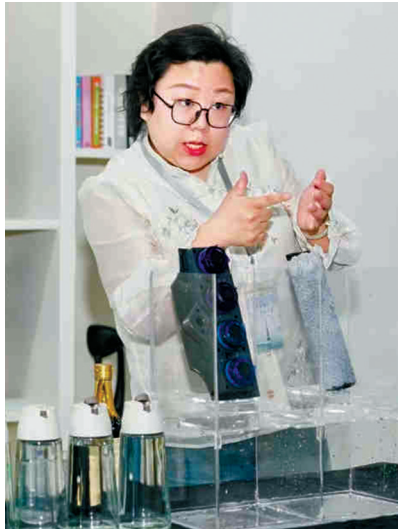
正在直播带货的井井。

听障直播间的购物主力也几乎是听障人士。百万元销售额对于主播而言,已是一个非常不错的成绩。