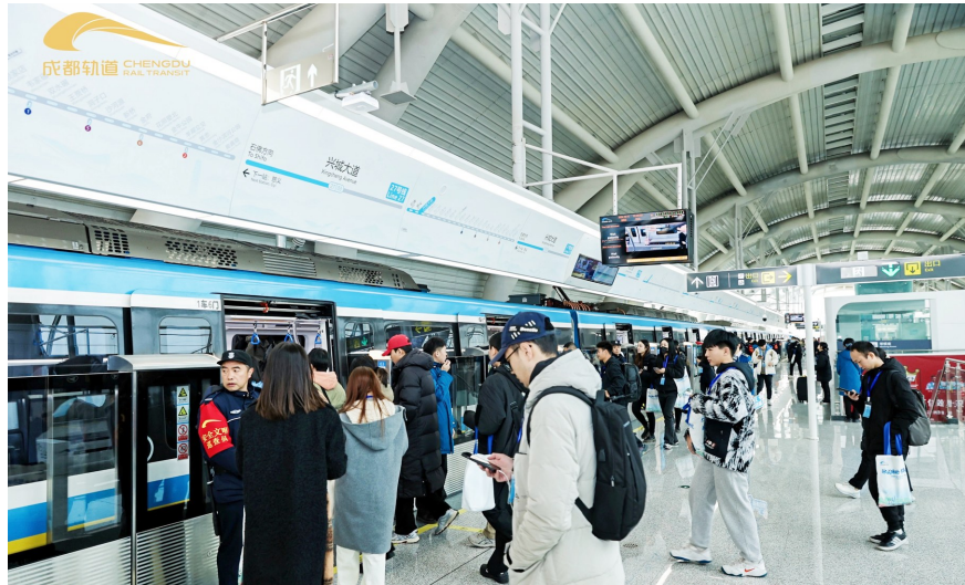
12月11日9:30,市民代表和建设者试乘地铁27号线。

27号线一期工程为成都地铁第二条全自动运行线路,北起新都区石佛站,西至青羊区蜀鑫路站,线路全长24.86公