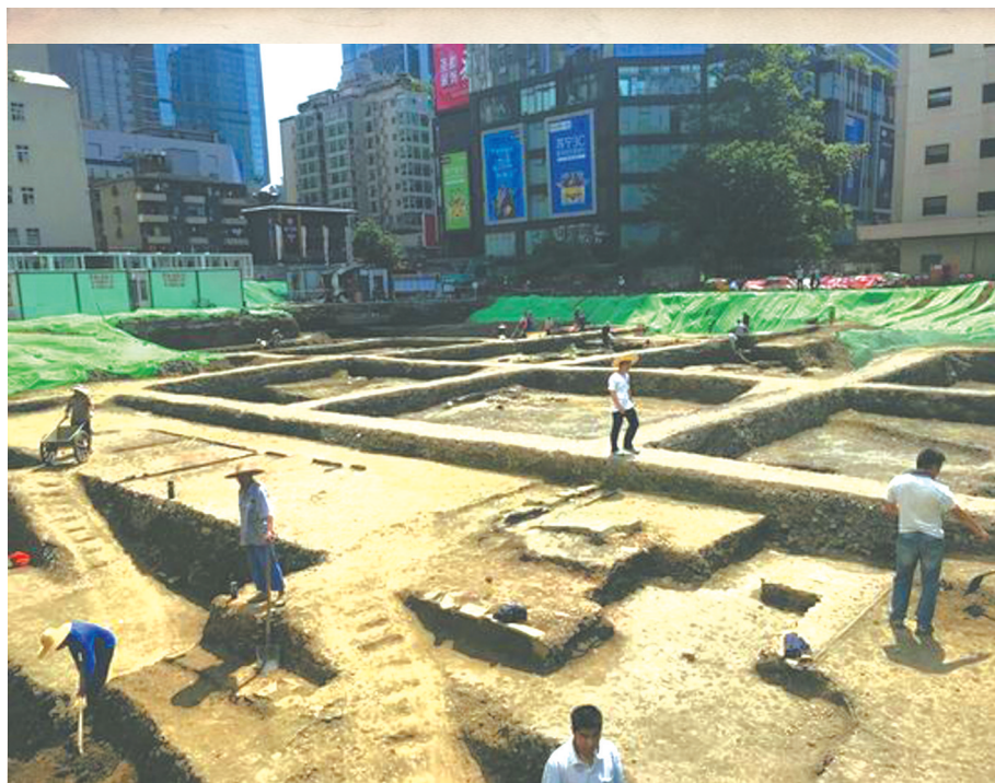
2018年，城守街遗址发掘现场。

值得一提的是，遗址内还发现了唐宋时期纵横交错、长达数十米的铺砖坊内街道。这些铺砖道路使用了特制的砖，并非一般房屋建筑砖石，其上可以看到大量行走、车辙的痕迹，类似现在铺设着彩砖的步行街广场。这在中国城市考古史上十分罕见，为研究中国古代建筑、城市规划等提供了宝贵材料。