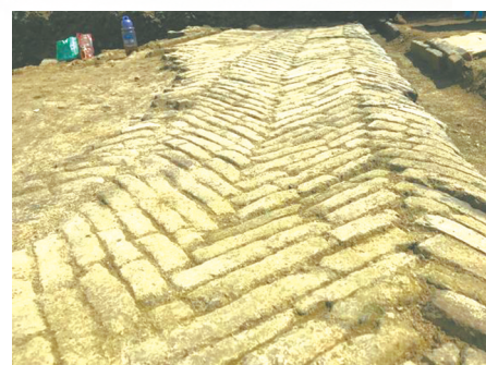
城守街遗址保存较为完好的道路，宽约1.45米，砖为特制。