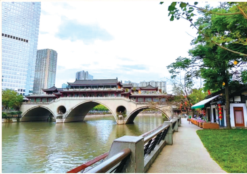
成都丝管路在安顺廊桥南岸。