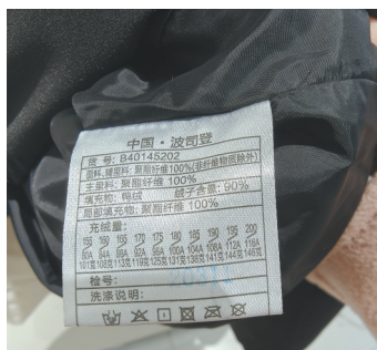
绒子含量成为衡量羽绒服品质新标准。