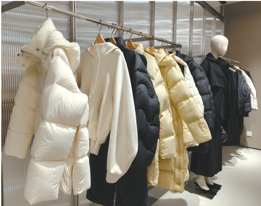
成都线下实体店羽绒服价格多在千元以上。

这些材料是如何分类、收集、加工,最后成为一件羽绒服成品的呢?从羽绒到羽绒服,需要经过很多道工序,才能达到产品相应标准。比如,羽绒本身的加工就需要经过预分、除灰、精分、洗涤、脱水、烘干、冷却、检验和包装等工序。从羽绒到服装,又需要经过选料、裁剪、缝制、充绒、熨烫、检验和包装等工序。