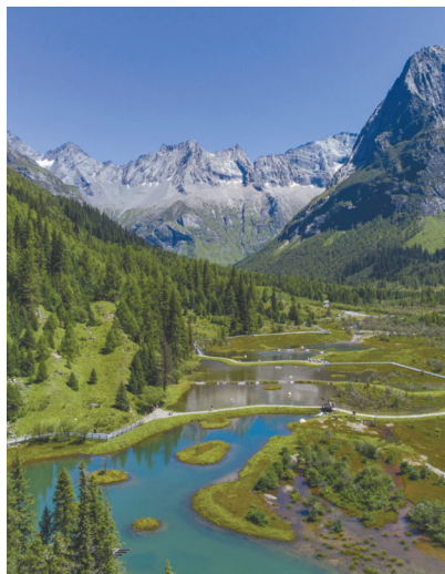
雪山彩林小西环线之旅上的四姑娘山双桥沟景区。

十条入境游精品线路是文化和旅游厅结合9月推出的25条四川旅游风景道,进一步深度挖掘巴蜀文化精髓,整合四川五大自然和文化遗产、大熊猫、冰雪温泉、阳光康养等优势旅游资源推出的全新线路,包括展现四川自然生态之美、多彩人文之韵的“四川世界遗产经典之旅”“四川萌宠大熊猫生态之旅”“雪山彩林小西环线之旅”“四川冰雪奇缘之旅”“四川冬日温暖阳光之旅”“行走中国318国道”“寻觅香格里拉之旅”“黑神话悟空四川取景地打卡之旅”“烟火成都CITY WALK之旅”“双城记”巴蜀探秘之旅“四川美食之旅”。