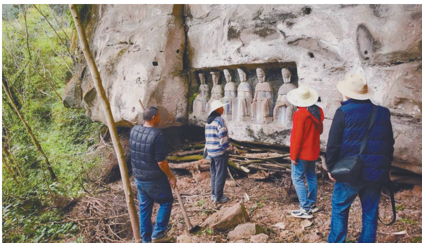
普查队员观察新发现的石窟寺点位。

其中,从市级层面看,资阳市复查率100%、阿坝州复查率99.77%、遂宁市复查率99.38%,其他市(州)复查率均达到80%,基本完成了2024年“三普”不可移动文物复查工作目标。同时,在新发现不可移动文物方面,资阳市新发现不可移动文物360处,甘孜州新发现不可移动文物191处,阿坝州新发现不可移动文物167处。