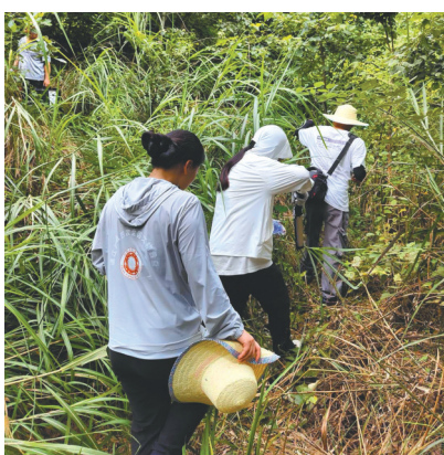
通江县文物普查人员在实地调查中。