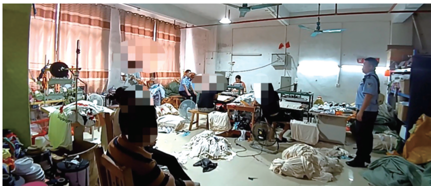
民警捣毁制假工厂。