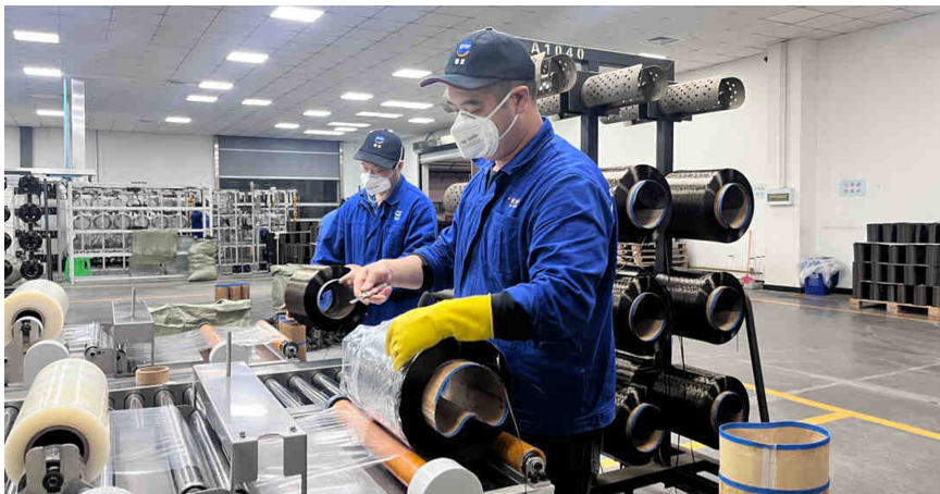
华蓥市四川谦宜复合材料有限公司工人正在打包玄武岩纤维。

要改变它的结构绝非易事。因为天然玄武岩化学成分具有不稳定性，配料主要是为了产品的性能稳定，“否则将影响纤维的特性和最终产品的质量。”