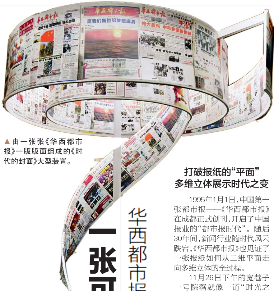
▲由一张张《华西都市报》一版版面组成的《时代的封面》大型装置。