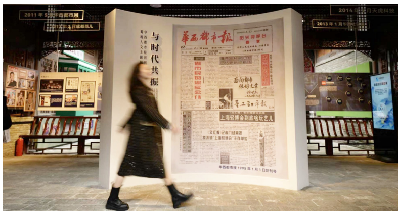
▲展厅大门处展示的《华西都市报》创刊号。