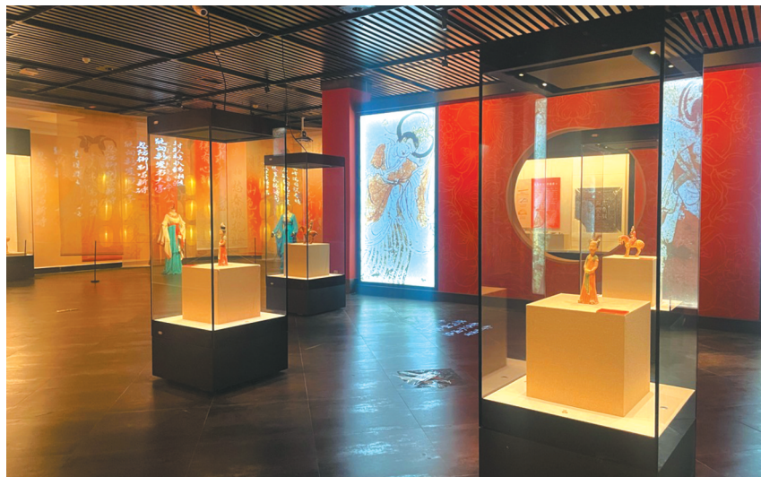
在永陵博物馆展出的“柳丝梅绽正芳菲——初唐女性掠影展”现场。

踏入展厅，映入眼帘的除了红色纱幔和灯笼，以及昭陵壁画图案所营造出绚丽多彩的大唐气象之外，最吸引眼球的，莫过于展柜中的文物了。漫步于展陈文物间，观众仿佛被带回唐朝初年。唐朝建立之初，政治清明、经济复苏、社会安定、文化繁荣、审美多元。唐太宗在位期间，出现了“贞观之治”的兴盛局