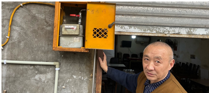
老钟家燃气已断供近4个月。