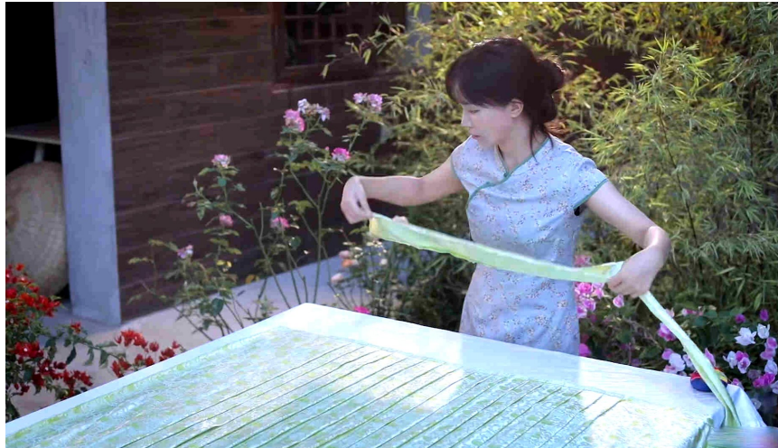
李子柒在视频中展示制作蜀锦裙。

漆器是中国古代在化学工艺及工艺美术方面的重要发明。漆器制作工艺繁琐，有“一杯卷用百人之功，一屏风就万人之功”之说，常规的漆器制作包括设计、制木胎、漆工、打磨、装饰、推光、抛光