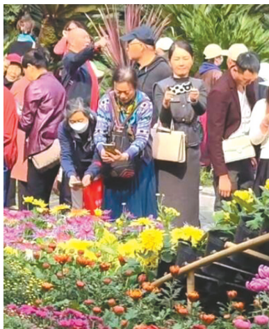
到人民公园赏菊，是成都人与秋天的约定。

到了清末，成都已有众多花农种植菊花。那时成都三洞桥、东郊以及龙爪堰有很多花农，光三洞桥周边的菊花花农就有20多户。而其中最著名的花农当属《成都通览》中提到的朱懋先，此人曾种植过上万株菊花，品种上千，如深紫、墨紫、金红、朱砂香菊等，这些菊花后来成为人民公园菊展中名贵品种的来源。