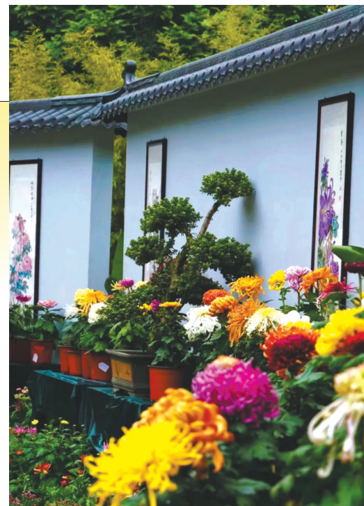
人民公园展出的菊花。