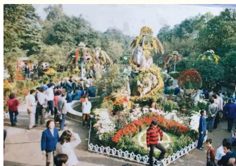
人们在人民公园赏菊的老照片。