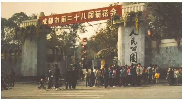
人民公园举办成都市第二十八届菊花会时的照片。