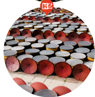
图一:四川非遗蜀锦。 刘可欣摄 图二:郫县豆瓣晒场。 刘可欣摄