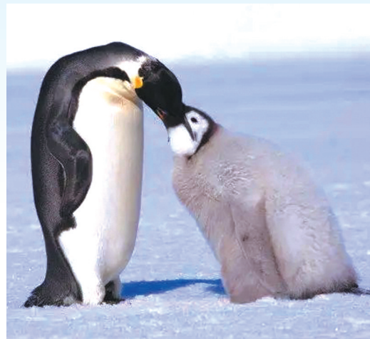
一只成年的帝企鹅在为幼企鹅喂食。