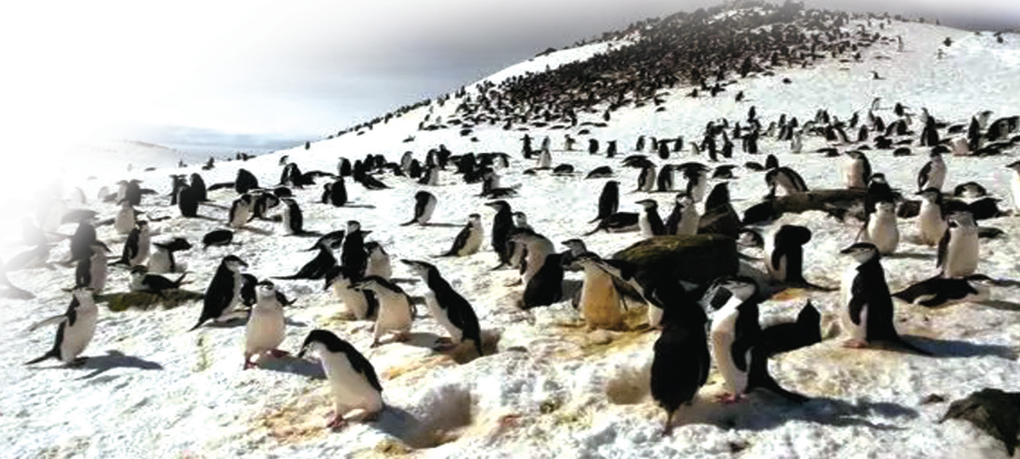
2007年11月23日在南极乔治王岛拍摄的企鹅照片。