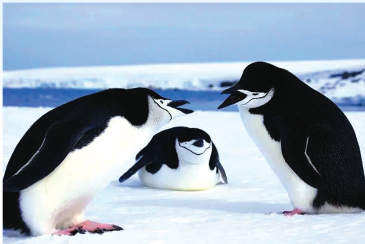
2009年11月15日在南极拍摄的两只正在“吵架”的帽带企鹅。

阿德利企鹅擅长游泳,但主要分布在南极水域,距离新西兰惠灵顿4000多公里。在人们的印象中,企鹅大多生活在南极,它是怎么样来到新西兰的,非常令人好奇。