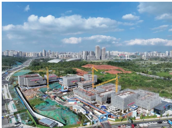
石室中学云龙校区附属小学项目。