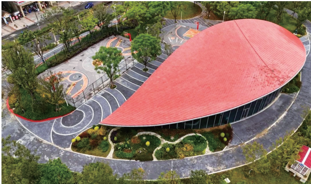
郫都区红光街道红光里公园。

同时，围绕“鼓励市民积极参与、收集市民诉求意见、邀请市民建言献策、欢迎市民监督体验、增强市民科学认知、倡导文明绿色出行”等方面，陆续开展