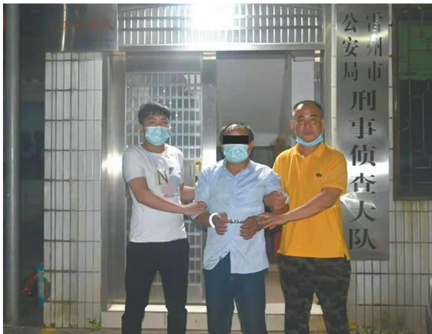
2020年5月，“易某青”在广西桂林市永福县被抓。