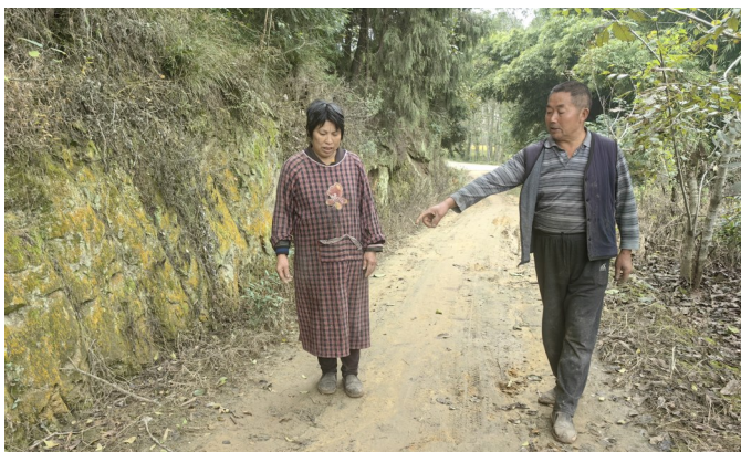
绵阳市三台县西平镇马房楼村的村民介绍“断头路”的情况。