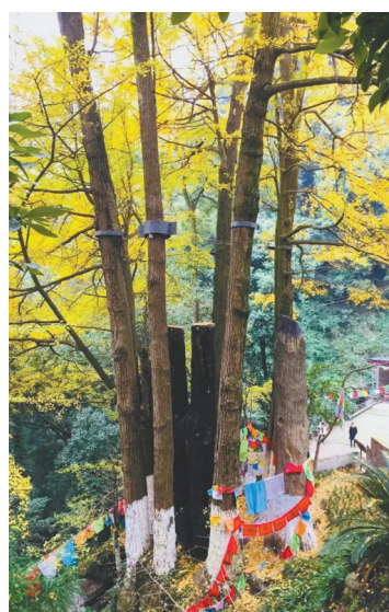
白岩寺“九子连株”银杏