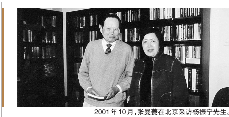
2001年10月，张曼菱在北京采访杨振宁先生。

张曼菱后来也庆幸自己的这一决定。因为她所采访的对象，大都年事已高，有的在视频整理过程中相继辞世。抢救性采访带来的收获是不可再生的绝版史料。张曼菱的采访成果，为当代人认识与研究“西南联大”提供了重要的一手资料。