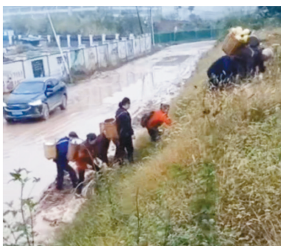
网友发布的视频显示，因为道路满是泥泞，多位背着背篓的村民爬上路边的护坡行走。

是绕道步行来搭乘4路公交车的，她告诉记者，她来自尖山社区四组，自从事发路段变成这样后，每次搭乘公交车都要绕道，要多走一半的路，“穿鞋子怎么走嘛，（那里面）到处都是泥巴。”