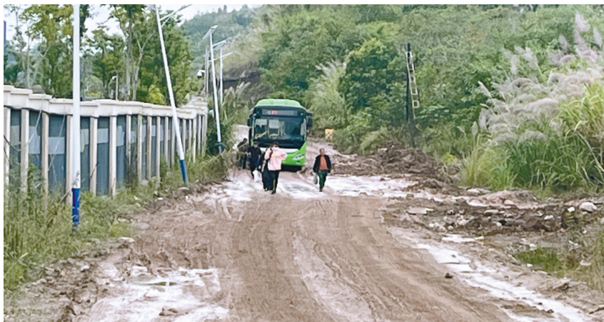
10月21日11时50分许，一辆从建政村往城北市场方向行驶的4路公交车在道路中央搁浅，乘客只能步行走出。

对此，简阳市空天产业功能区管理委员会规划建设部表示，该路段是因道路路网建设临时开辟的便道，被其他项目工程车碾压损坏，此前已修补多次。东溪街道尖山社区回应称，该路段属于附近村民出行的交通要道，村民多次向上反映，但问题未得到根本解决。