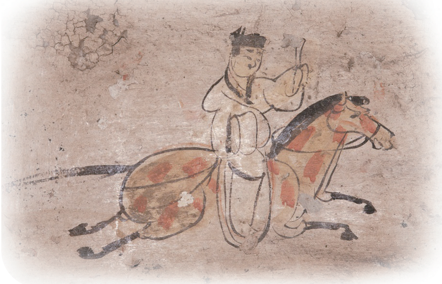
驿使图。现藏甘肃省博物馆