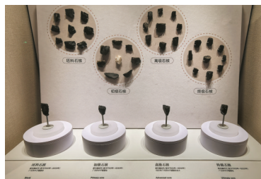
博物馆的展品。刘彦谷 摄