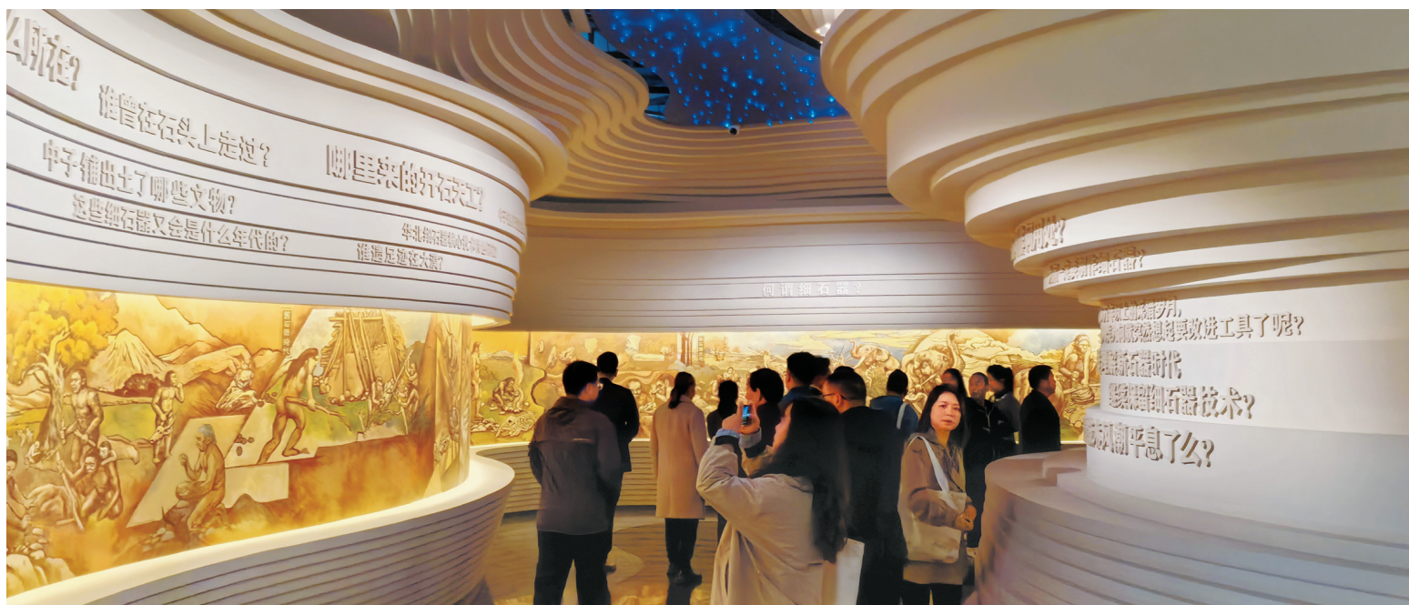
10月20日，位于广元市朝天区的中子铺细石器考古博物馆正式开馆。