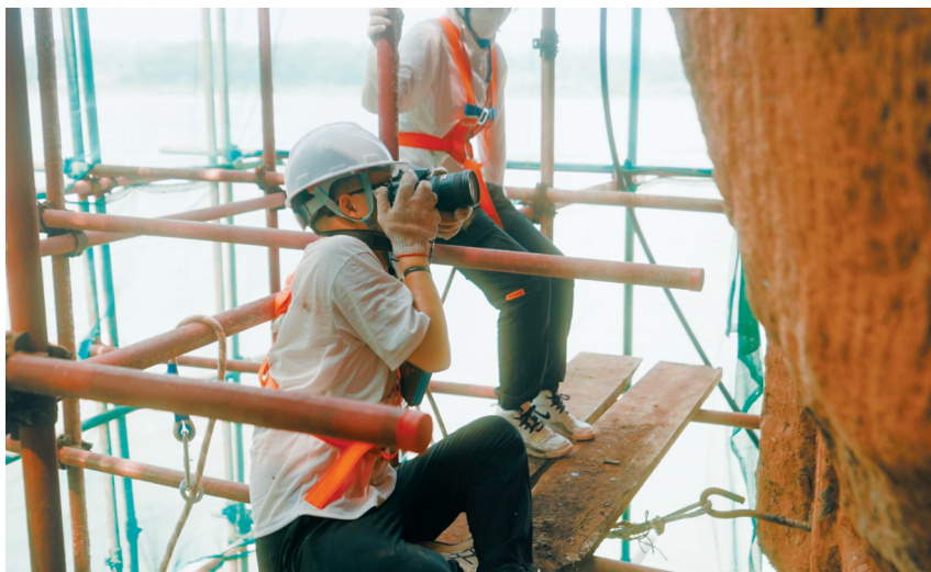
普查队员正在悬崖之上开展乐山大佛遗产地“四普”工作。

据介绍，在乐山大佛右侧通高70余米、近乎垂直的崖壁上，分布着大大小小55龕摩崖造像。这些龕像高悬崖壁，远离栈道，饱受风化病害，于是，详细记