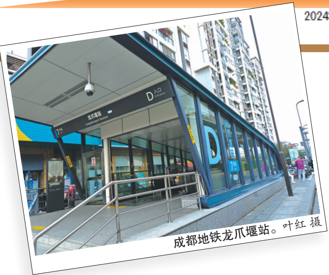
成都地铁龙爪堰站。