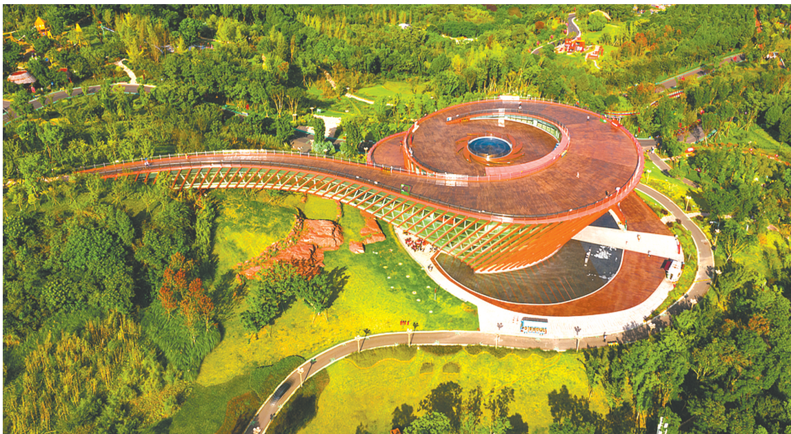
成都龙泉山城市森林公园丹景山景区航拍图。

此外，成都还有龙井村、龙爪堰、龙须巷、青龙桥等等带“龙”的地名，一口气还说不完呢。