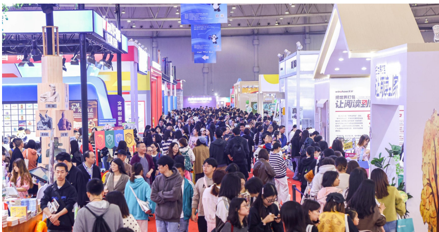
2024天府书展现场火爆,线下逛展人次远超历届。

通报会上,2024天府书展优秀分展场等奖项获奖名单也一并揭晓,共计8类奖项105个获奖项目。其中包括:人民出版社等10家单位获评2024天府书展优