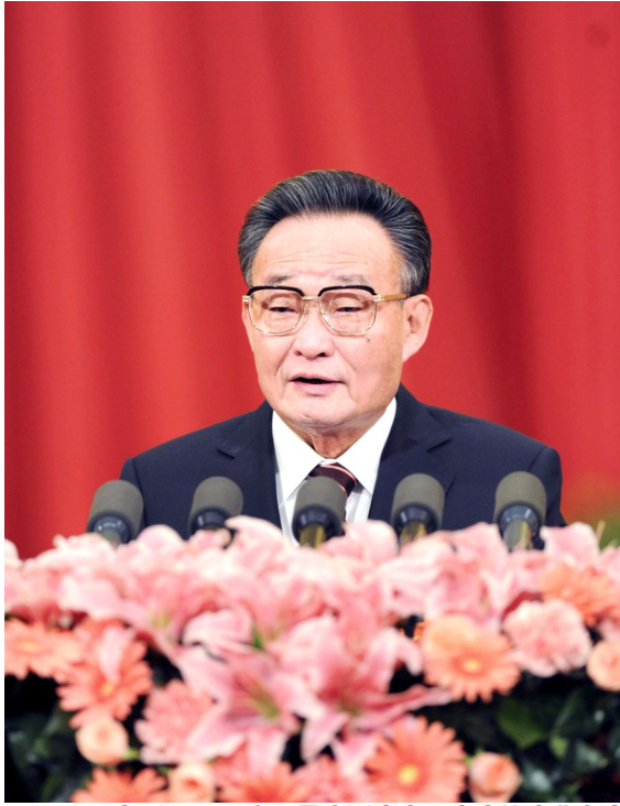
2011年3月10日,十一届全国人大四次会议在北京人民大会堂举行第二次全体会议。吴邦国同志作全国人民代表大会常务委员会工作报告。

吴邦国同志高度重视人大监督工作,明确提出“围绕中心、突出重点、讲求实效”的监督工作思路,完善监督工作方式方法,有力推动了党中央重大决策部署贯彻落实。任期内,全国人大常委会共听取和审议“一府两院”报告126个,组织执法检查46次,对环保、司法等多个领域开展跟踪监督。他坚持人大监督工作要推动民