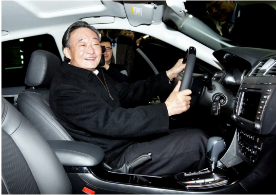
2010年1月30日,吴邦国同志在上海汽车集团股份有限公司技术中心察看新能源车。