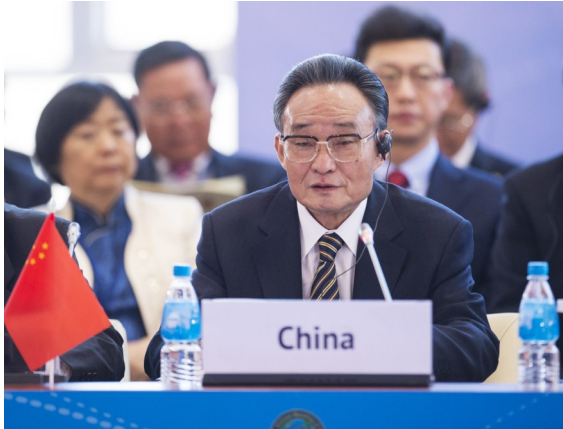
2013年1月28日,吴邦国同志在俄罗斯符拉迪沃斯托克出席亚太议会论坛第21届年会,并作题为《坚持和平发展 促进合作共赢》的主旨发言。

生问题解决,聚焦“三农”工作、劳动关系、食品安全等强化民生领域监督,着力解决人民群众最关心最直接最现实的利益问题。他坚持把推动工作和完善法律结合起来,本着对党和人民高度负责的精神,在认真研究论证、反复修改完善的基础上推动监督法颁布实施,促进人大监督工作进一步制度化、规范化、法治化。