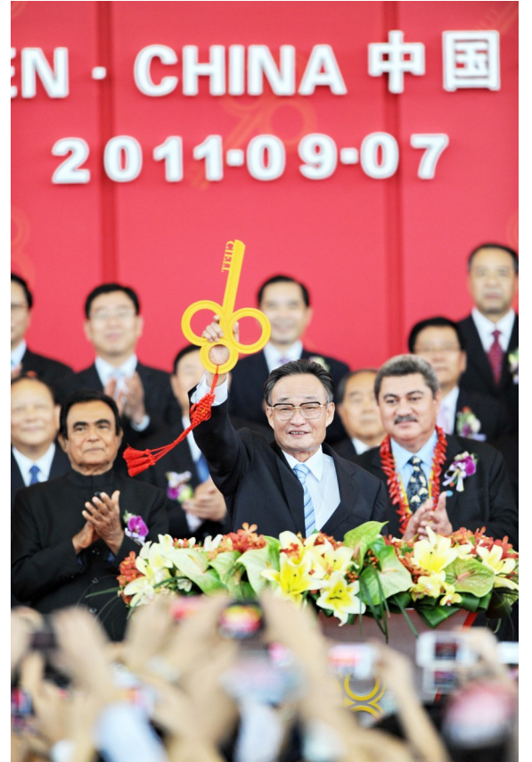
2011年9月7日,吴邦国同志在福建厦门出席第十五届中国国际投资贸易洽谈会开幕式。

2013年3月,吴邦国同志不再担任全国人大常委会委员长职务。从领导岗位上退下来以后,他坚决拥护和支持以习近平同志为核心的党中央领导,认真学习