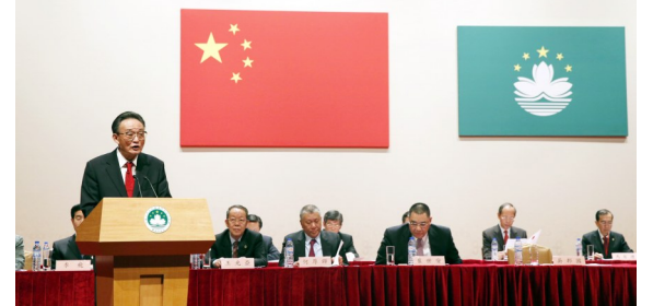
2013年2月21日,吴邦国同志在澳门文化中心出席澳门社会各界纪念澳门基本法颁布20周年启动大会并发表讲话。

习近平新时代中国特色社会主义思想,关心党和国家事业的发展,坚定支持党风廉政建设和反腐败斗争。