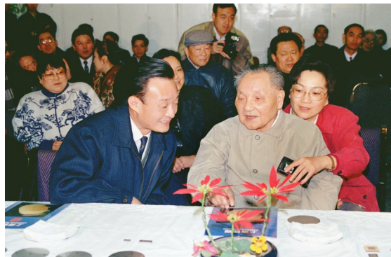
▲1992年2月10日,邓小平同志在上海贝岭微电子制造有限公司参观时与吴邦国同志交谈。 新华社发