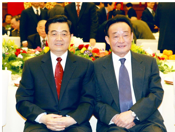
2005年1月1日,全国政协在北京举行新年茶话会。这是胡锦涛同志与吴邦国同志在一起。