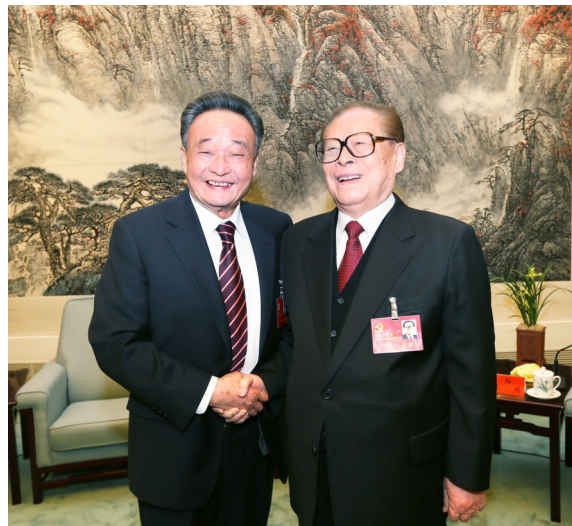
2012年11月14日,中国共产党第十八次全国代表大会在北京闭幕。这是闭幕会前,江泽民同志与吴邦国同志在一起。