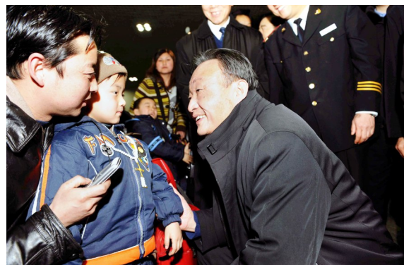
2008年2月3日,吴邦国同志在北京西站候车室与旅客交谈。

中国共产党的优秀党员,久经考验的忠诚的共产主义战士,杰出的无产阶级革命家、政治家,党和国家的卓越领导人,中国共产党第十四届中央政治局委员、中央书记处书记,第十五届中央政治局委员,第十六届、十七届中央政治局常委,国务院原副总理,第十届、十一届全国人民代表大会常务委员委员长吴邦国同志,因病医治无效,于2024年10月8日4时36分在北京逝世,享年84岁。