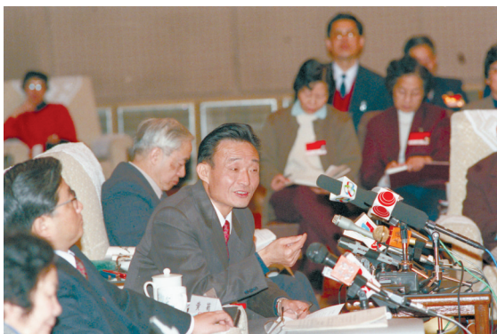
1994年3月,时任上海市委书记的吴邦国同志在全国两会上海代表团全团会议上。