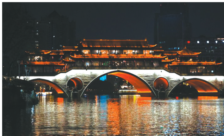
成都锦江安顺廊桥夜景。

安顺廊桥位于府河与南河交汇处附近，是一座具有浓郁历史文化气息的桥梁。这座桥原名长虹桥，清乾隆年间由华阳县令安洪德重修，并更名为安顺桥。桥上曾建有房屋和风雨长廊，是市民避雨和休息的好地方。如今，安顺廊桥已成为成都的网红打卡地之一，到了晚上，桥上灯光璀璨，漂亮迷人。