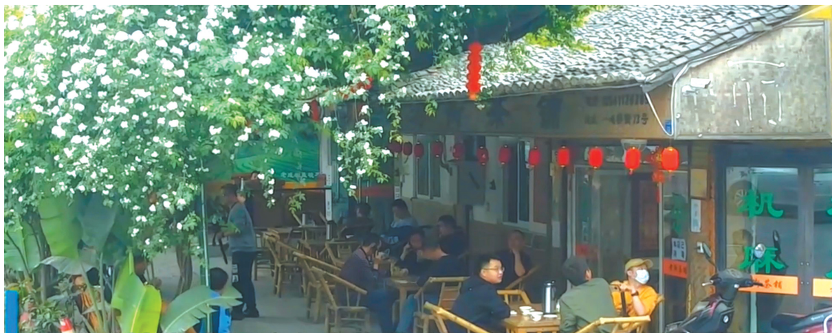
一心桥的老茶铺。