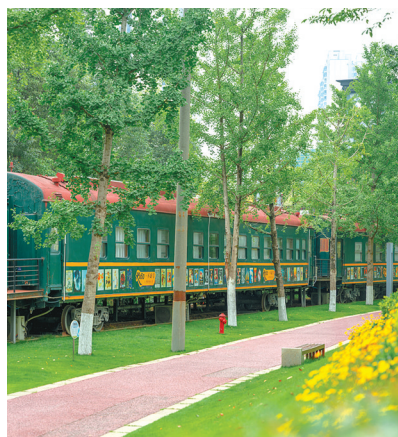
二仙桥公园婚姻登记处。图据视觉中国

成都主城区以数字开头的街道名,唯独缺了以“六”开头的。这可能是巧合,也可能是因老派四川话里“六”和“落”同音,大家