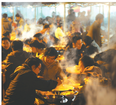
2009年12月22日,三官堂羊肉汤生意火爆。