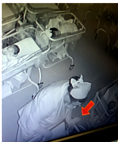
月子中心工作人员多次手腕发力拍打婴儿。视频监控截图

“这确实是我们妹妹的动作不太规范。”“她的操作不规范，这个我们也承认确实是我们不对的地方。”