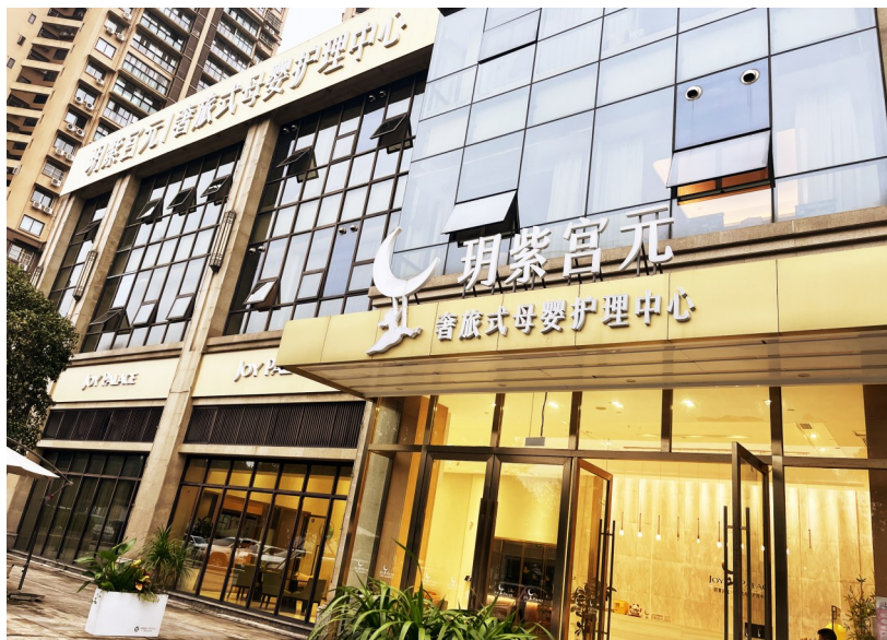
玥紫宫元奢旅式母婴护理中心。

对此，月子中心胡姓院长称不认可派出所的表述，在月子中心看来，员工是在安抚婴儿，没有不规范的地方，家长有异议，可以走法律途径。