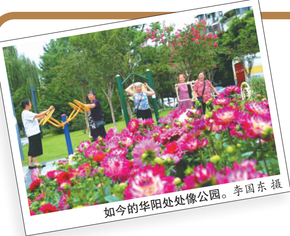
如今的华阳处处像公园。