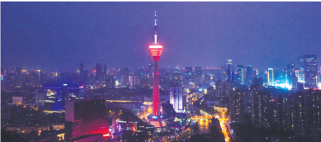
位于成华区的天府熊猫塔是成都标志性建筑之一。

清代成都流传着一句妇孺皆知的顺口溜：“成华简崇汉，温郫崇新灌，新新崇双什，金堂十六县”，凝练地概括了成都府所辖的三州十三县。第一句中“成”指的是“成都县”，而“华”就是“华阳县”。