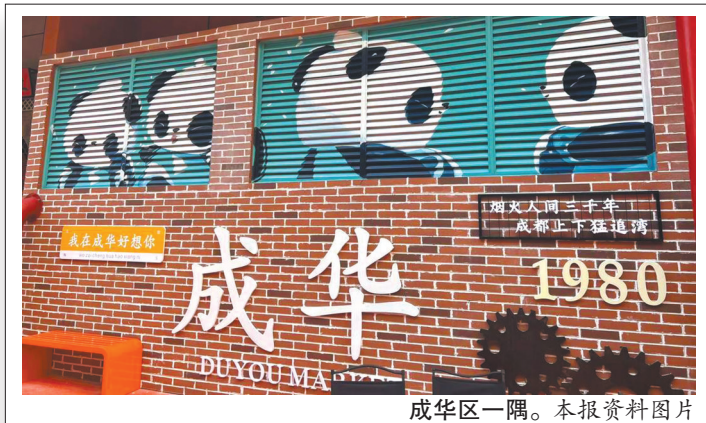
成华区一隅。

参考资料：《成都市志(1990-2005)》《成都市成华区志(1990-2005)》