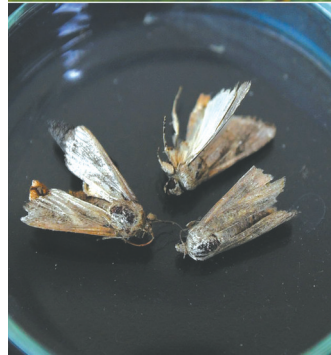
草地贪夜蛾。图据新华社