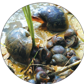
福寿螺。图据新华社