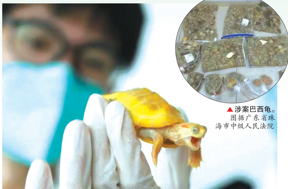
▲涉案巴西龟。