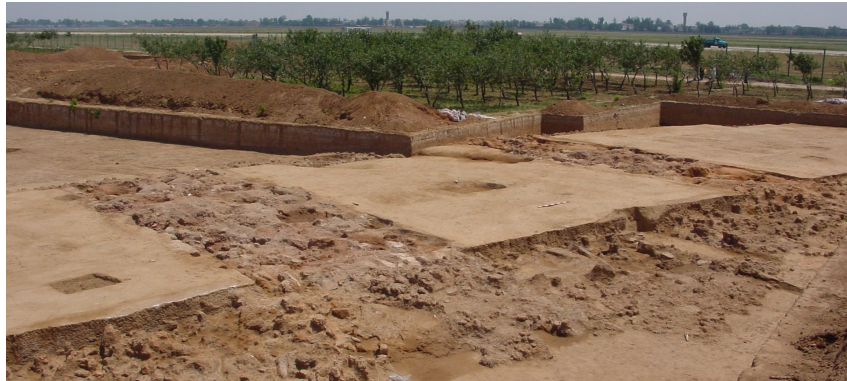
洹北商城庭院入口倒塌现场清理后的场景。

“我在殷墟这么多年，见证了殷墟遗址发掘的大多数节点。”大到洹北商城的发现、殷墟申报世界文化遗产成