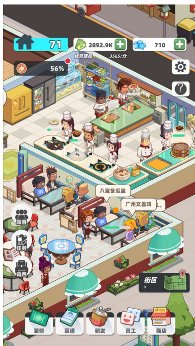
成都零下七度科技公司开发的美食类游戏截图。

成都拥有发达的移动互联网基础，当部分手游公司率先开启出海业务后，对于许多一个项目十年磨一剑的台式电脑(PC)游戏厂商来说，海外