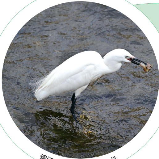
锦江公园的白鹭。

“布谷布谷”“叽又”……每按一次按钮，听筒里都会响起杜鹃、白鹭等对应鸟儿的动听歌声，超级有趣。