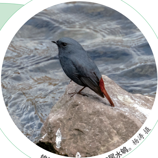
锦江百花潭段拍到的红尾水鸊。杨涛摄