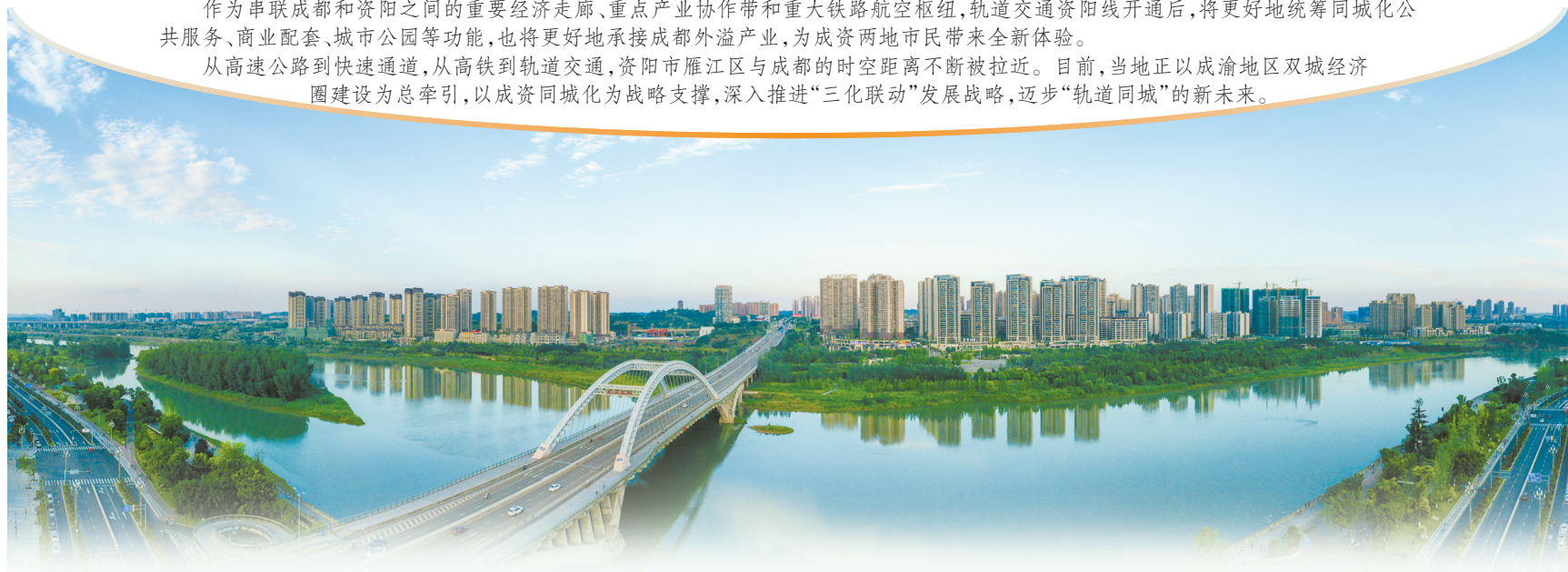
雁江城市风光。

从高速公路到快速通道,从高铁到轨道交通,资阳市雁江区与成都的时空距离不断被拉近。目前,当地正以成渝地区双城经济圈建设为总牵引,以成资同城化为战略支撑,深入推进“三化联动”发展战略,迈步“轨道同城”的新未来。