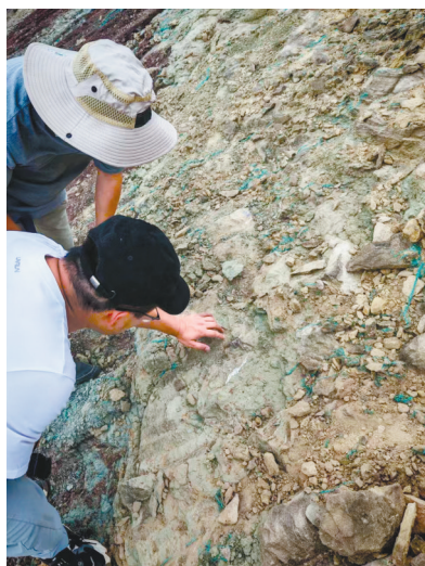
古生物专家正在查看化石。

的《自贡市恐龙地质遗迹保护条例》,经自贡市自然资源和规划局向自然资源厅报告,已将该处恐龙化石