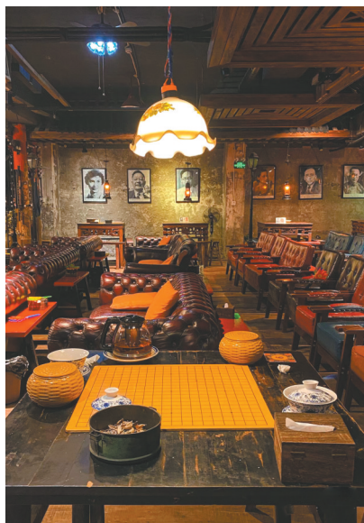
重庆鲁祖庙民国茶馆

会、川渝新青年消费节、玉林国际咖啡艺术节、第24届中国(四川)中秋食品博览会、“巴山蜀水 运动川渝”体育旅游休闲消费季等，超过1000家企业参与，举办超过100场配套活动，旨在通过一系列活动着力推动两地经济的深度合作与文化交流。