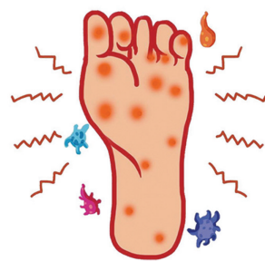
手足癣、头癣、疱疹等真菌感染