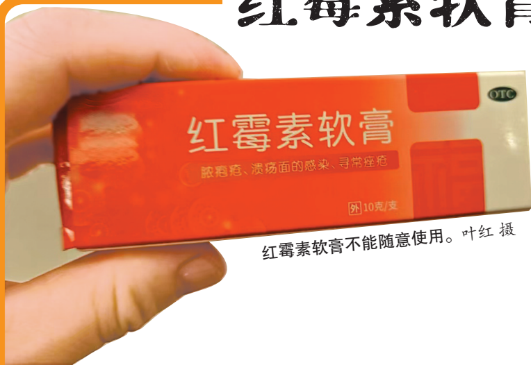
红霉素软膏不能随意使用。

因为便宜又有效,红霉素软膏是不少人家中的常备药。长痘痘、嘴角烂、烫伤、角膜发炎……抹点红霉素软膏就行?其实,红霉素软膏没那么万能,也不能频繁使用。本期少年派告诉你,一些家中常备药真不是万能神药,必须仔细阅读药品说明书后使用。